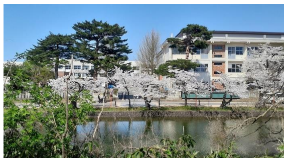
鶴岡公園から見える校舎