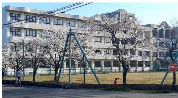
グラウンド越しに見える校舎